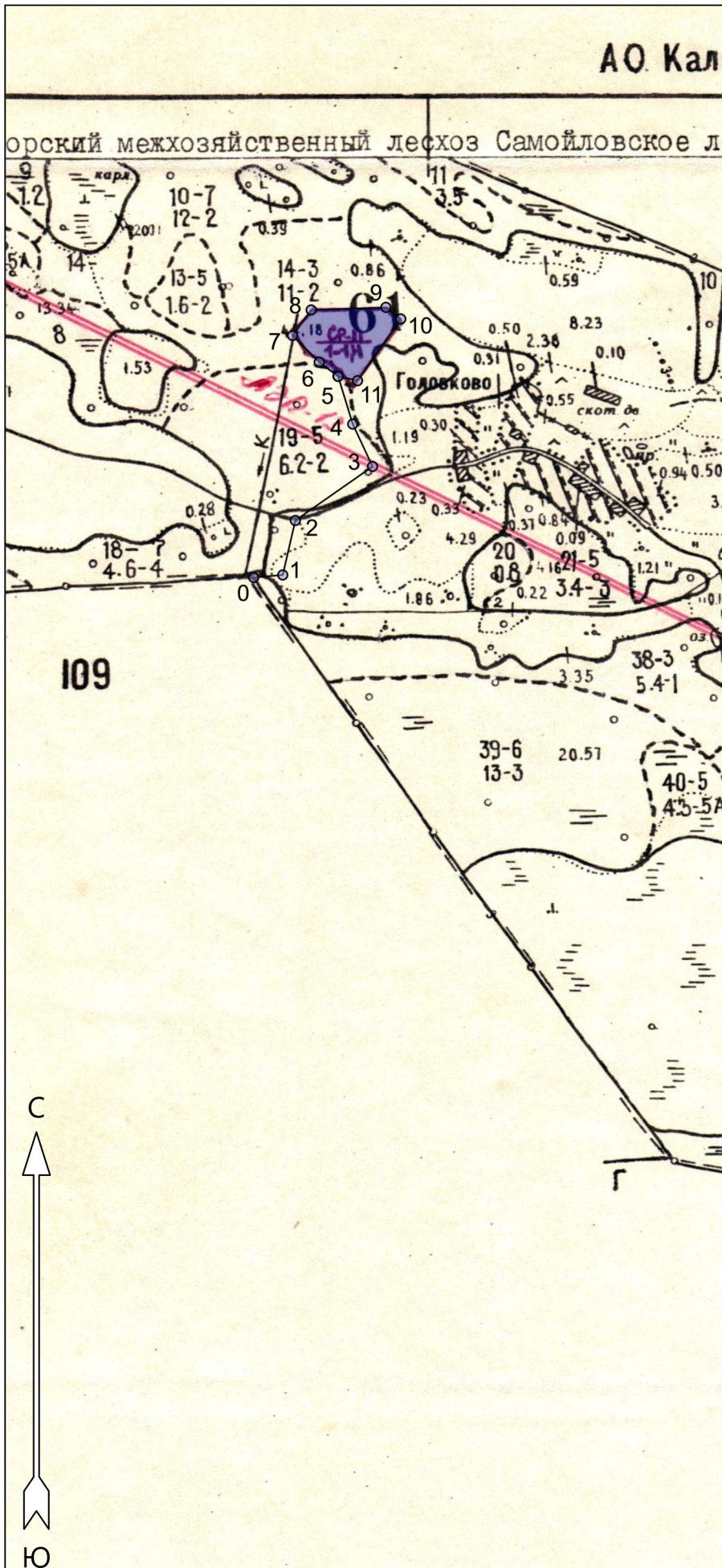
СХЕМА РАСПОЛОЖЕНИЯ УЧАСТКОВ ЛЕСНЫХ КУЛЬТУР Бокситогорское лесничество, Самойловское участковое лесничество, квартал 61, выдел 14. Площадь 1,4 га Масштаб: 1 : 10000