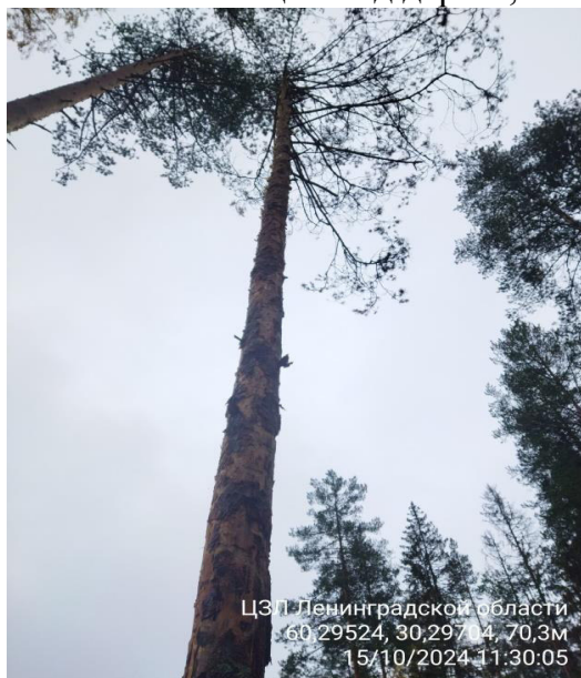
Фото № 1.1 Общий вид дерева, наличие сухих ветвей