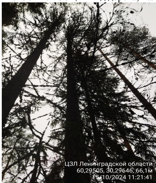
Фото № 1.1 Общий вид дерева, наличие сухих ветвей