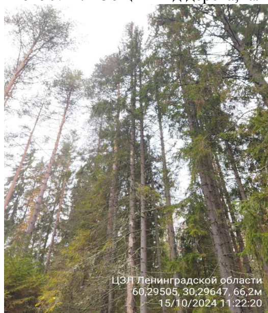
Фото № 1.1 Общий вид дерева, наличие сухих ветвей