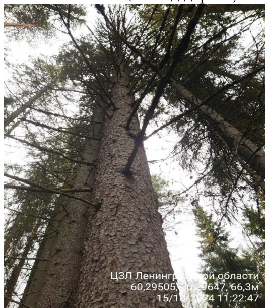
Фото № 1.1 Общий вид дерева, наличие сухих ветвей