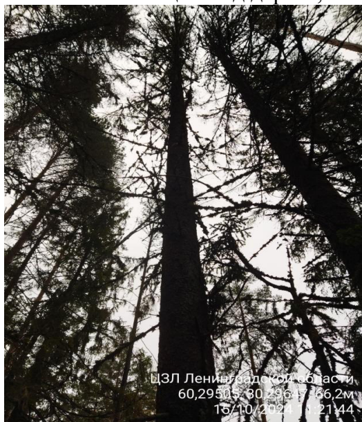
Фото № 1.1 Общий вид дерева, наличие сухих ветвей