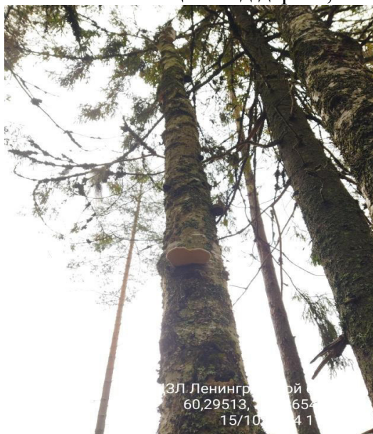
Фото № 1.1 Общий вид дерева, плодовые тела трутовиков