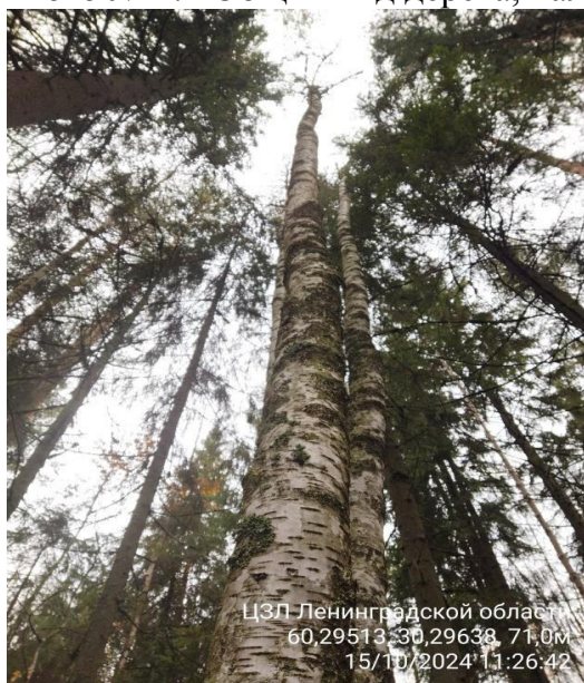
Фото № 1.1 Общий вид дерева, наличие сухих ветвей