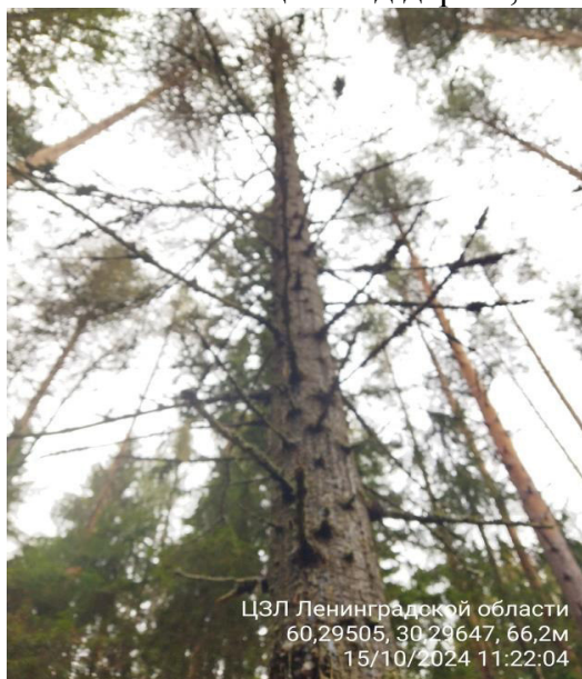
Фото № 1.1 Общий вид дерева, наличие сухих ветвей