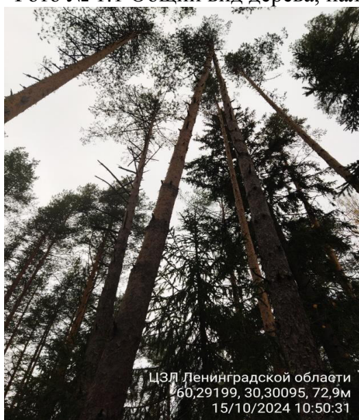
Фото № 1.1 Общий вид дерева, наличие сухих ветвей, опасный наклон ствола