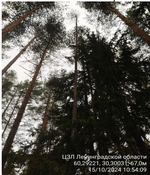
Фото № 1.1 Общий вид дерева, наличие сухих ветвей