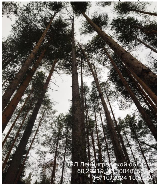
Фото № 1.1 Общий вид дерева, наличие сухих ветвей