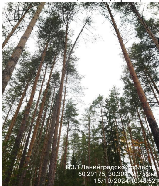
Фото № 1.1 Общий вид дерева, оасный наклон ствола