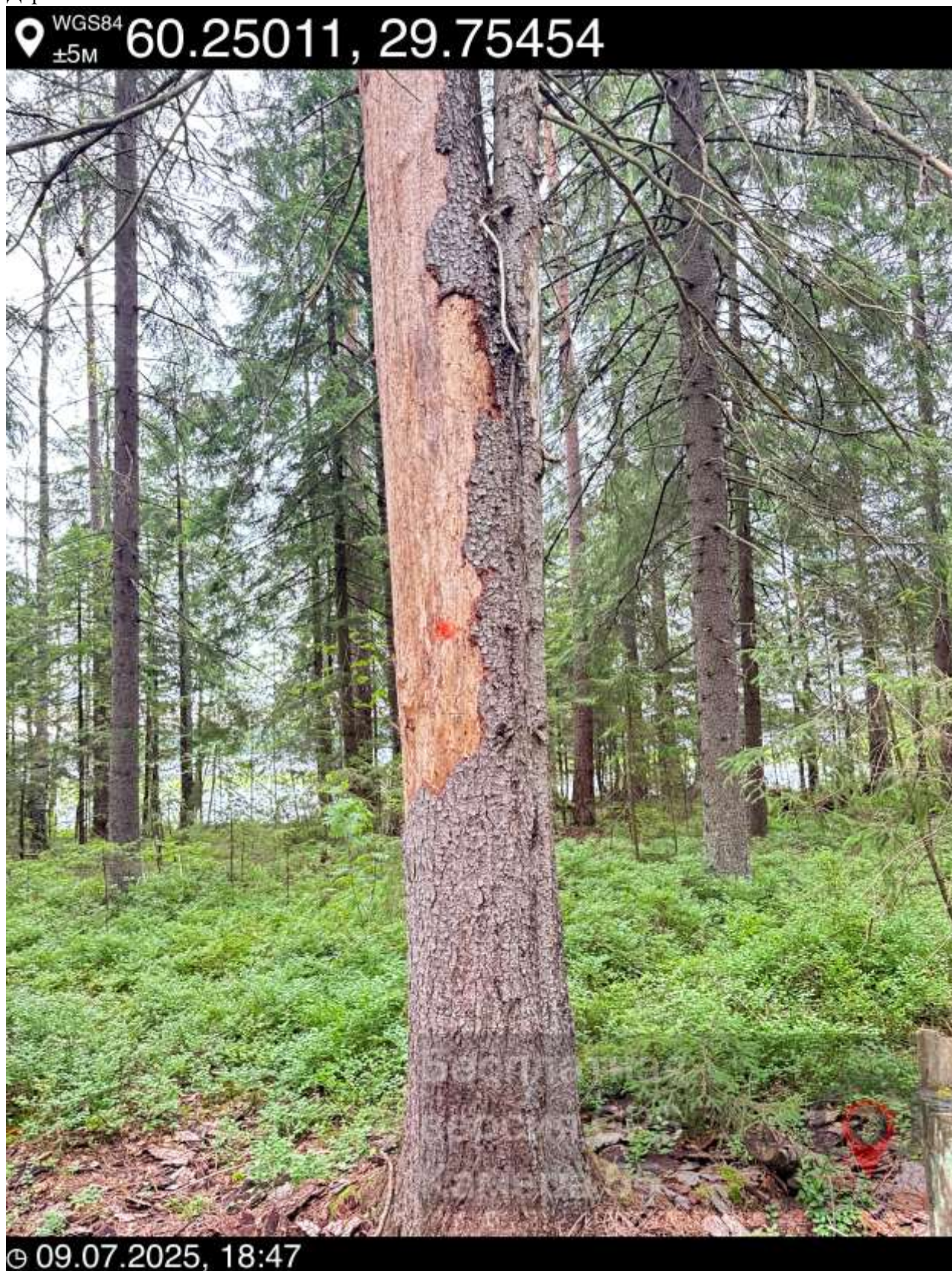
10. Дерево 10