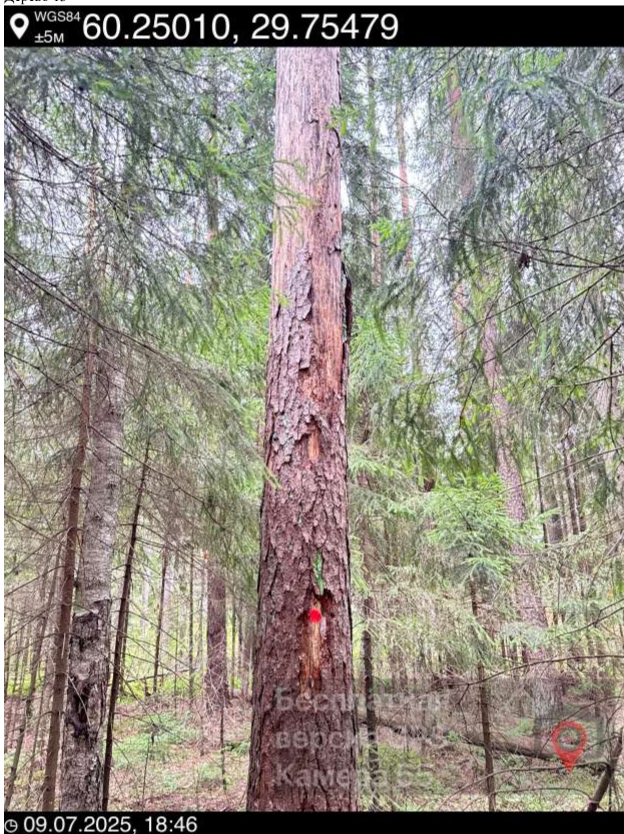
13. Дерево 13