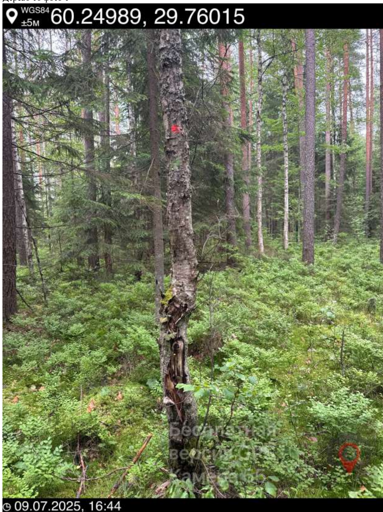
10. Дерево 10 фото 1