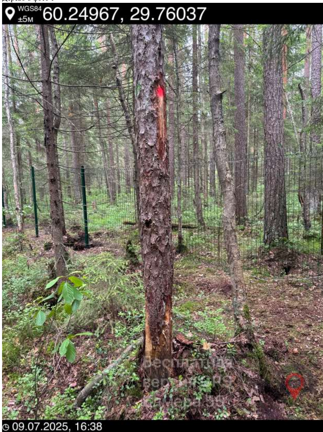
8. Дерево 8 фото 1