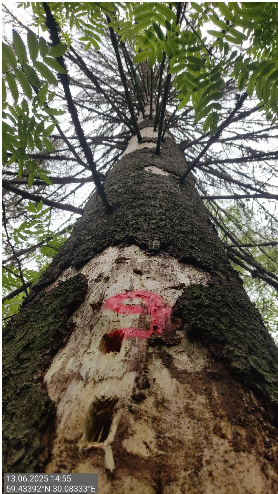
Дерево № 9