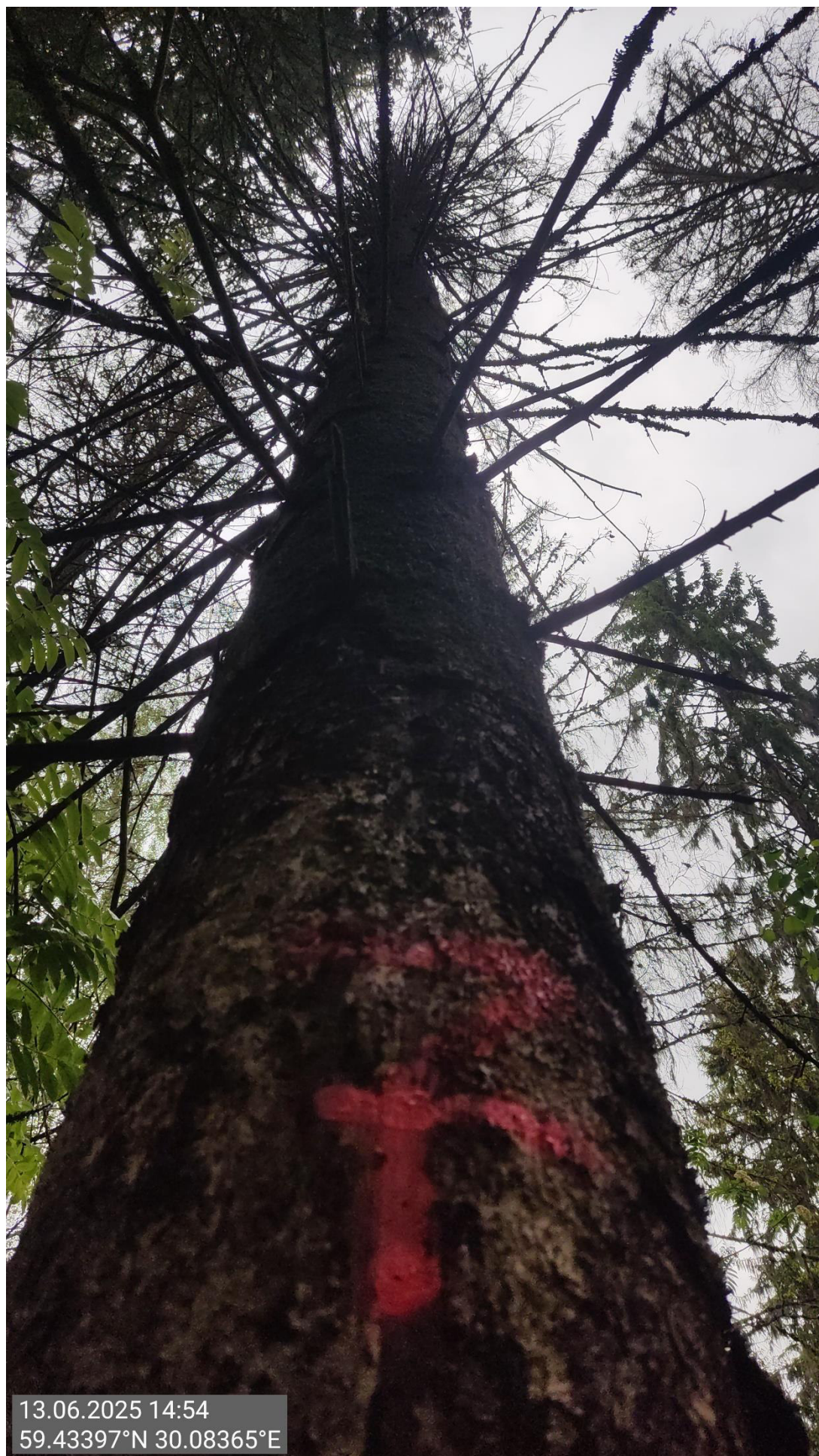
Дерево № 7