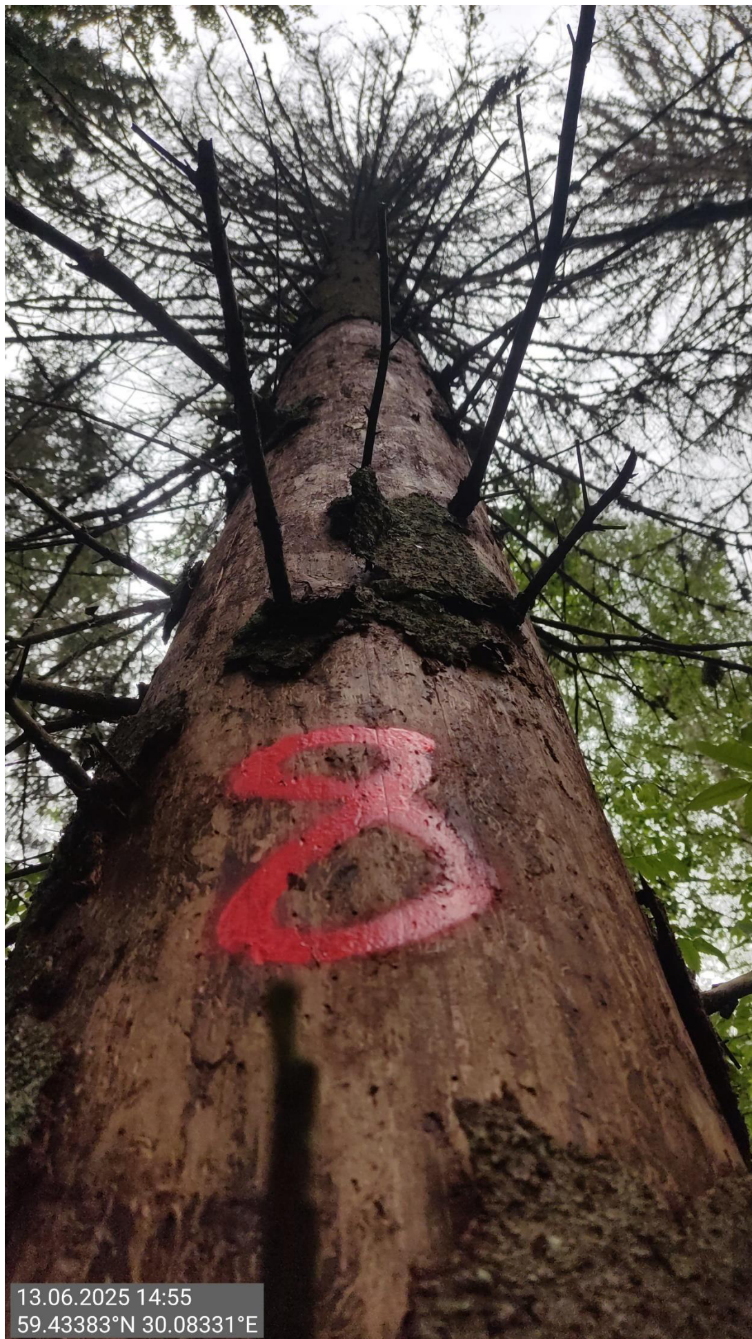
Дерево № 8