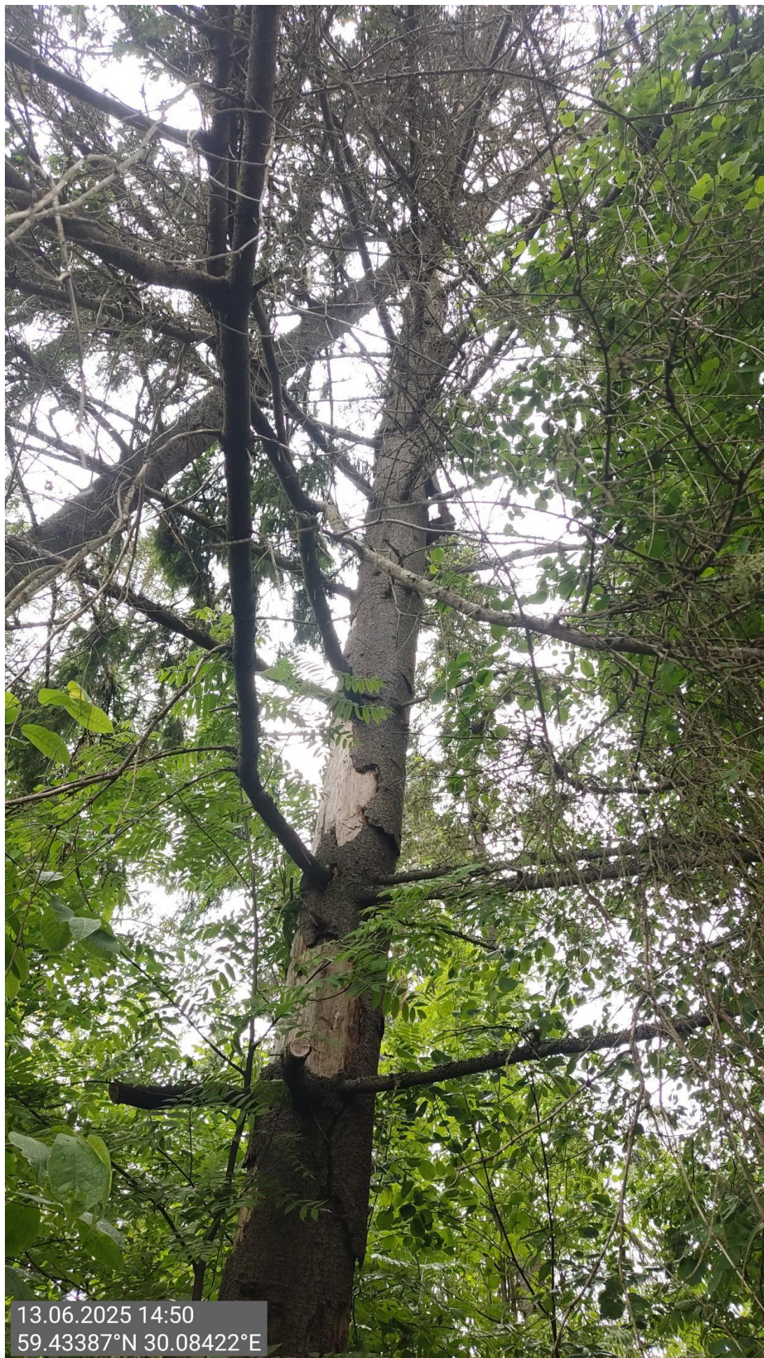
Дерево № 4