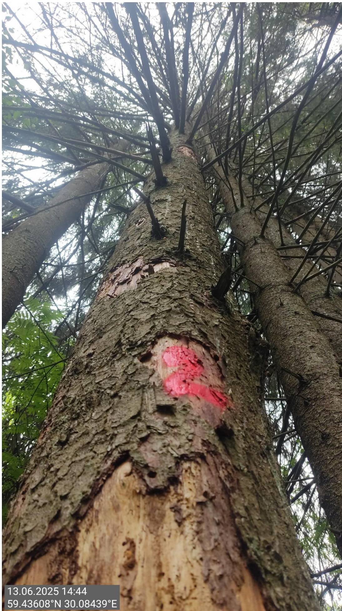
Дерево № 2