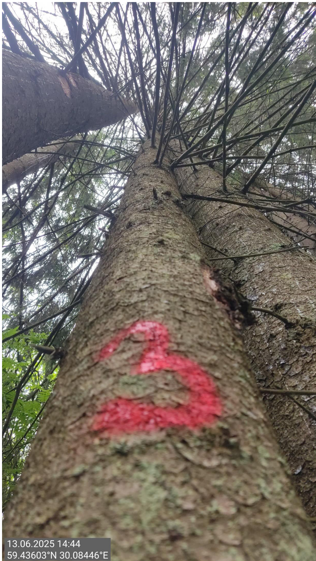
Дерево № 3