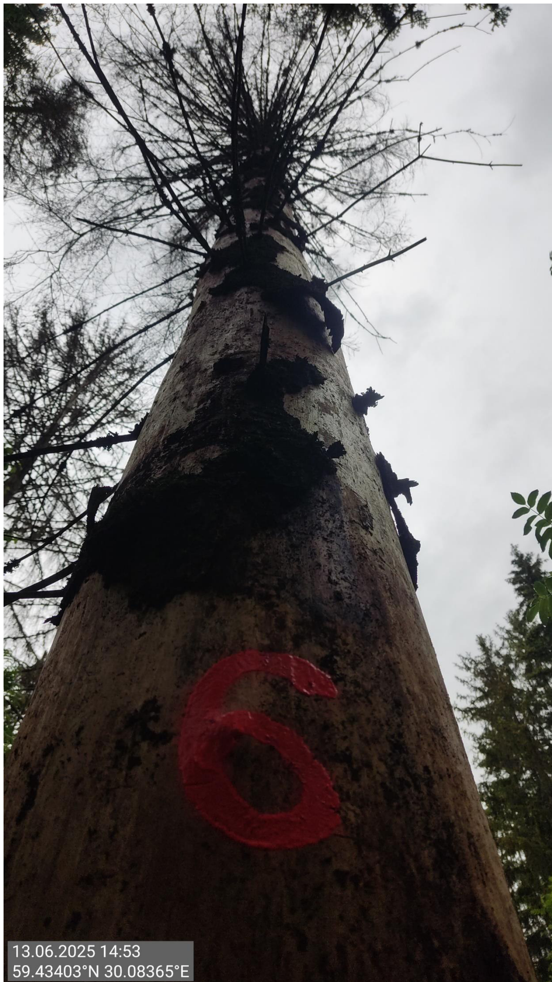
Дерево № 6