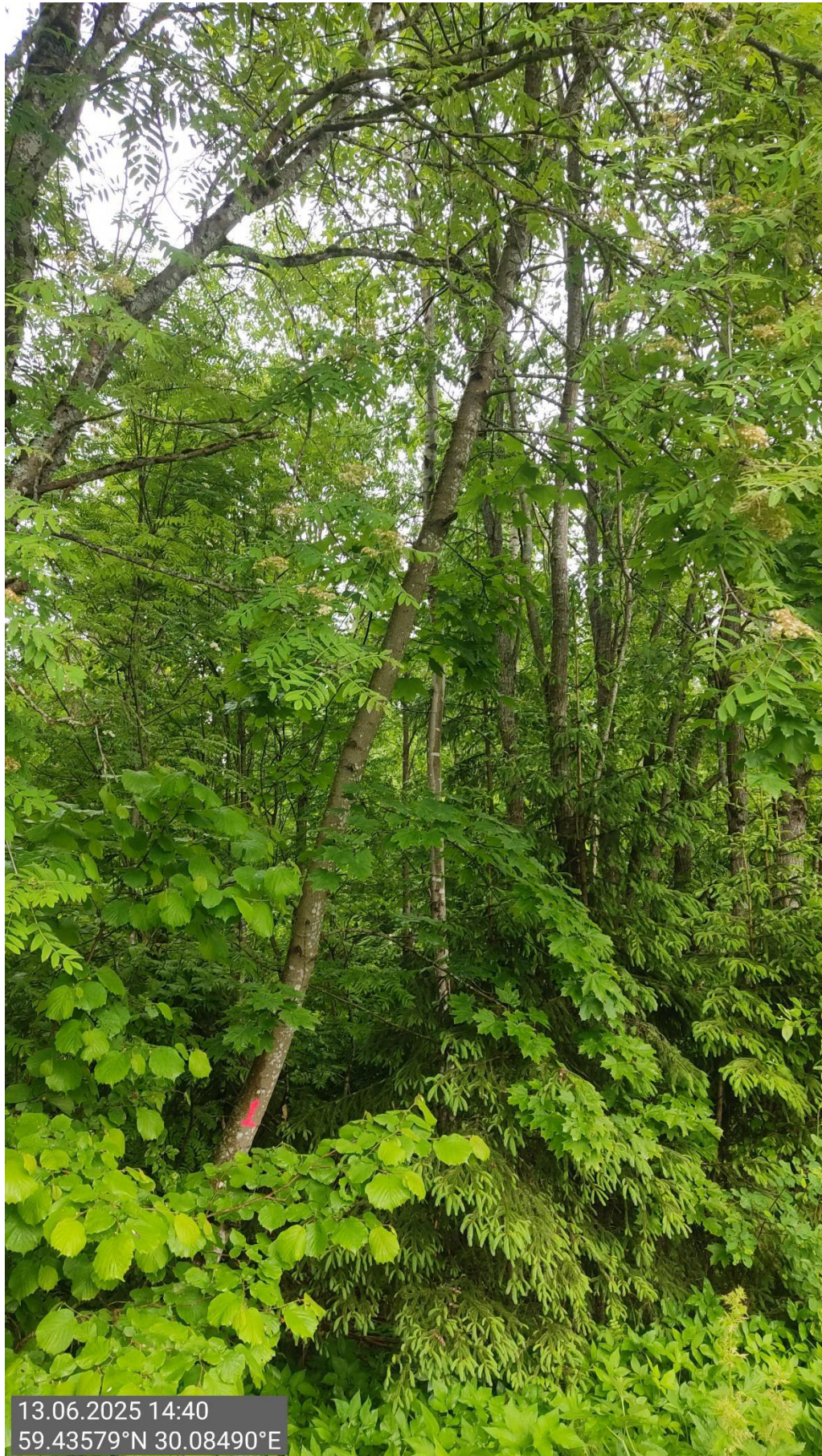
Дерево № 1