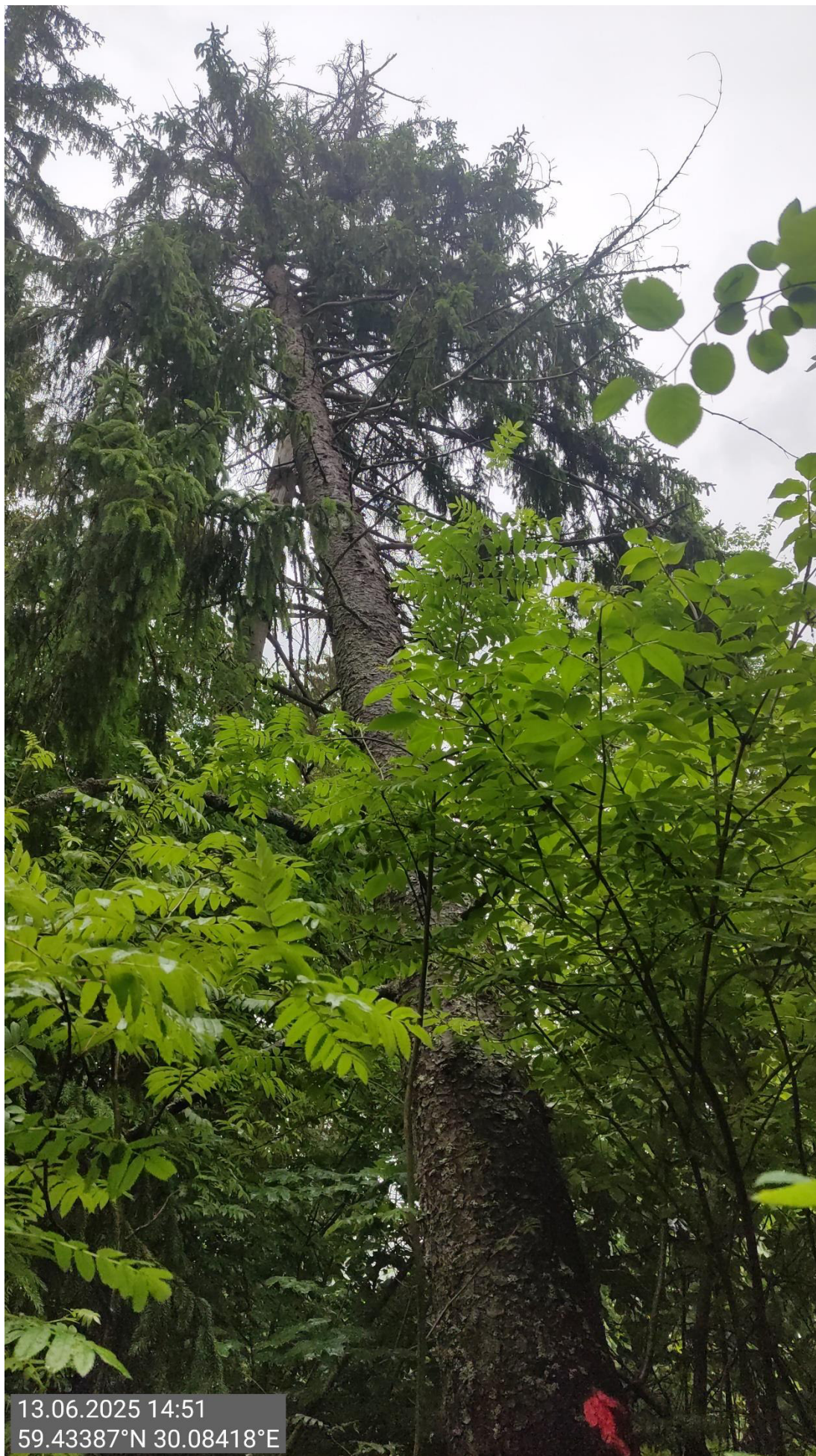
Дерево № 5