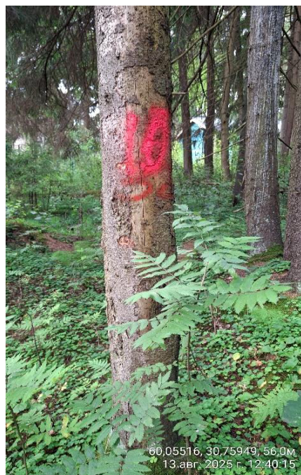
Фото № 10.1