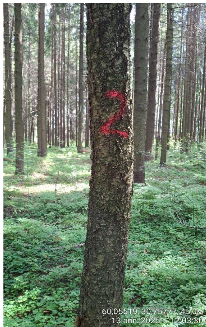
Фото № 2.1