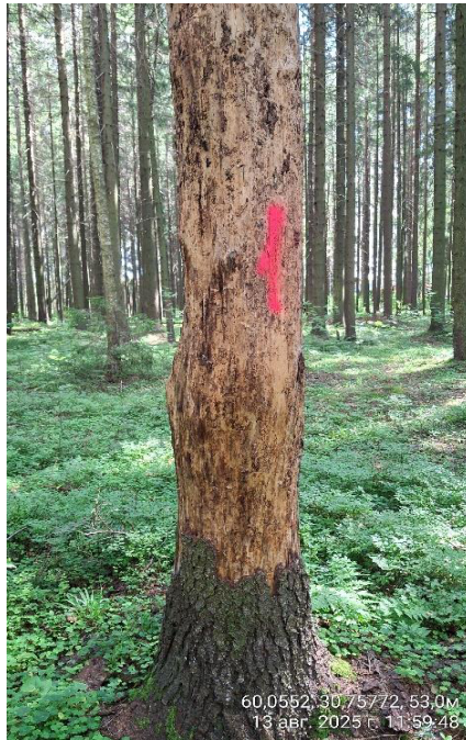
Фото № 1.1