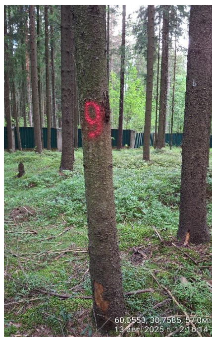
Фото № 9.1