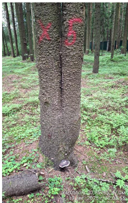
Фото № 5.1