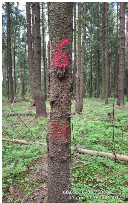
Фото № 6.1