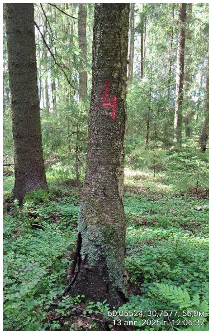
Фото № 4.1