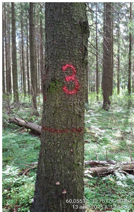
Фото № 3.1