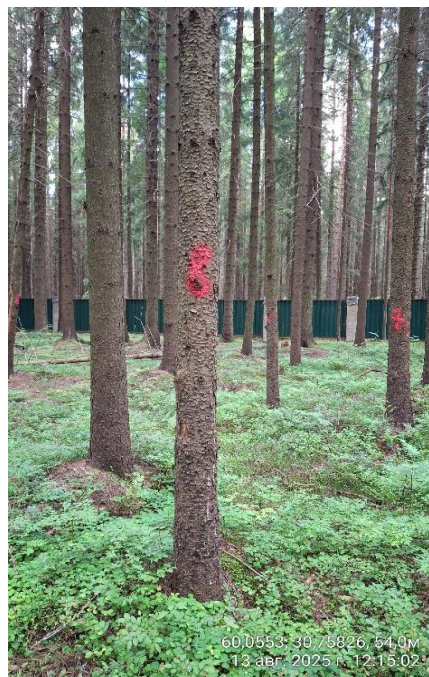
Фото № 8.1