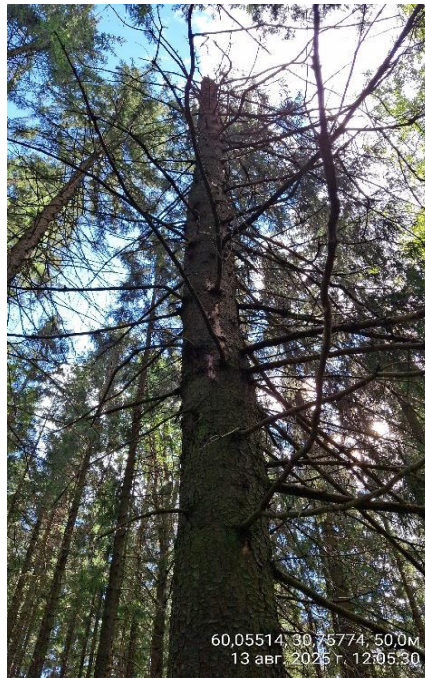
Фото № 3.2