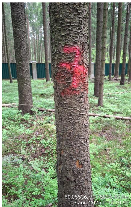
Фото № 7.1