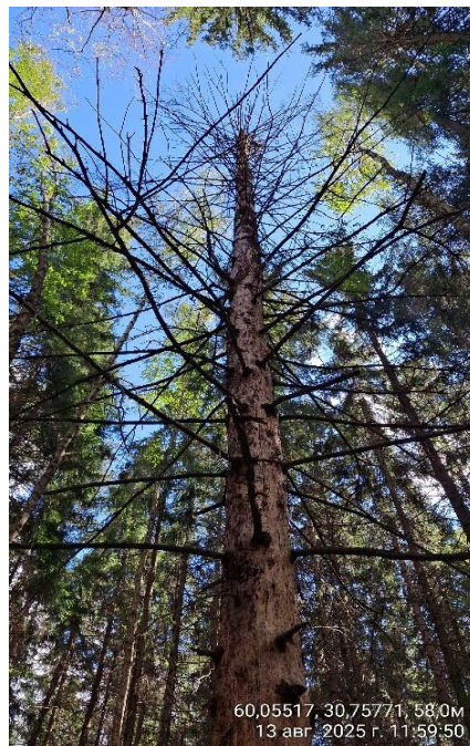
Фото № 1.2