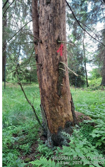
Фото № 1.2