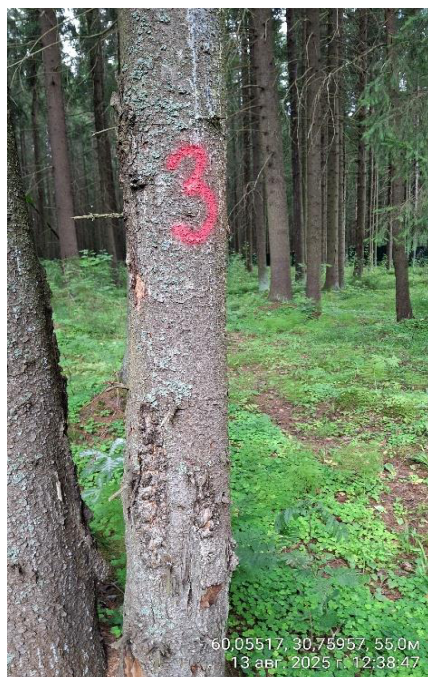
Фото № 3.1