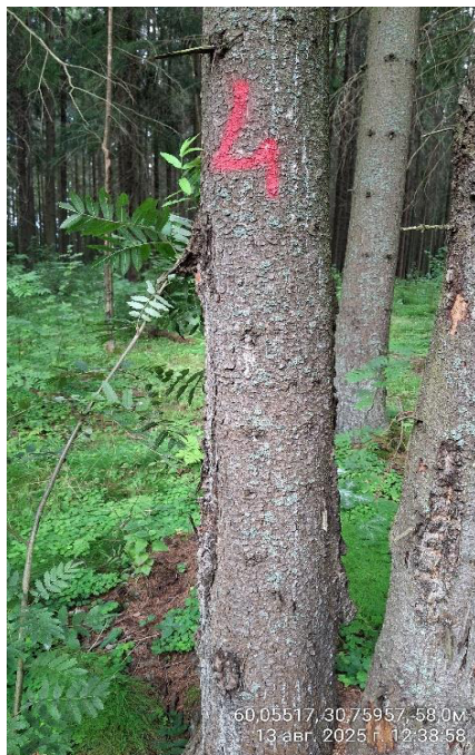
Фото № 4.1