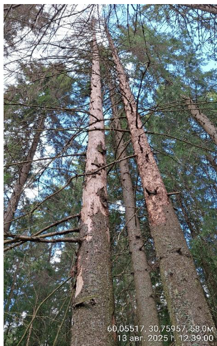
Фото № 4.2