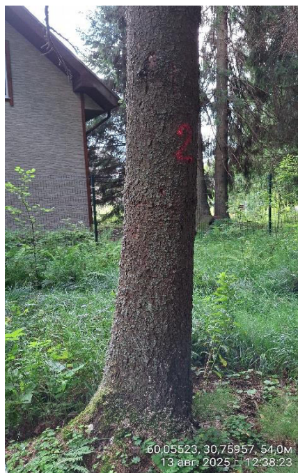
Фото № 2.1