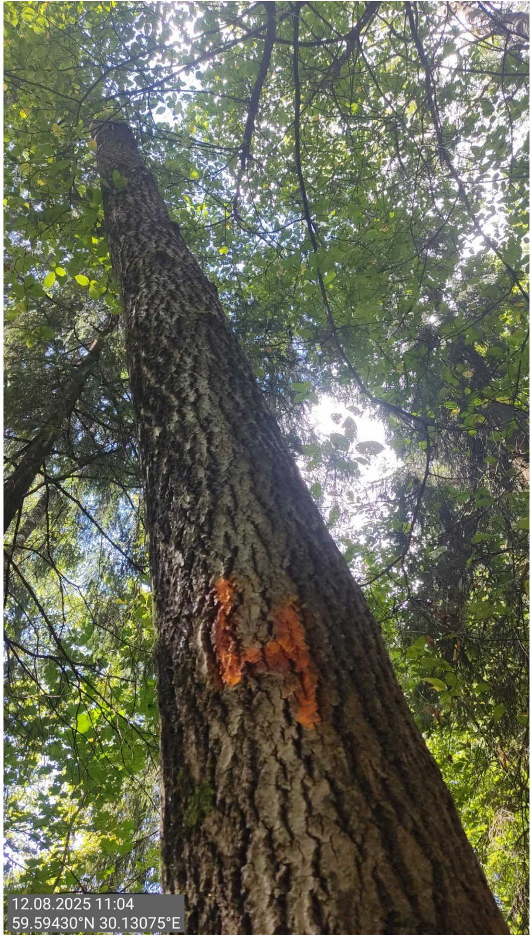
Дерево № 4