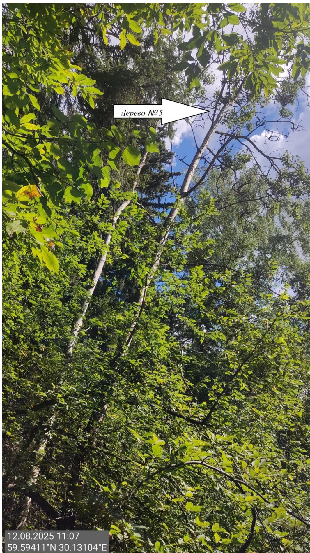
Дерево № 5