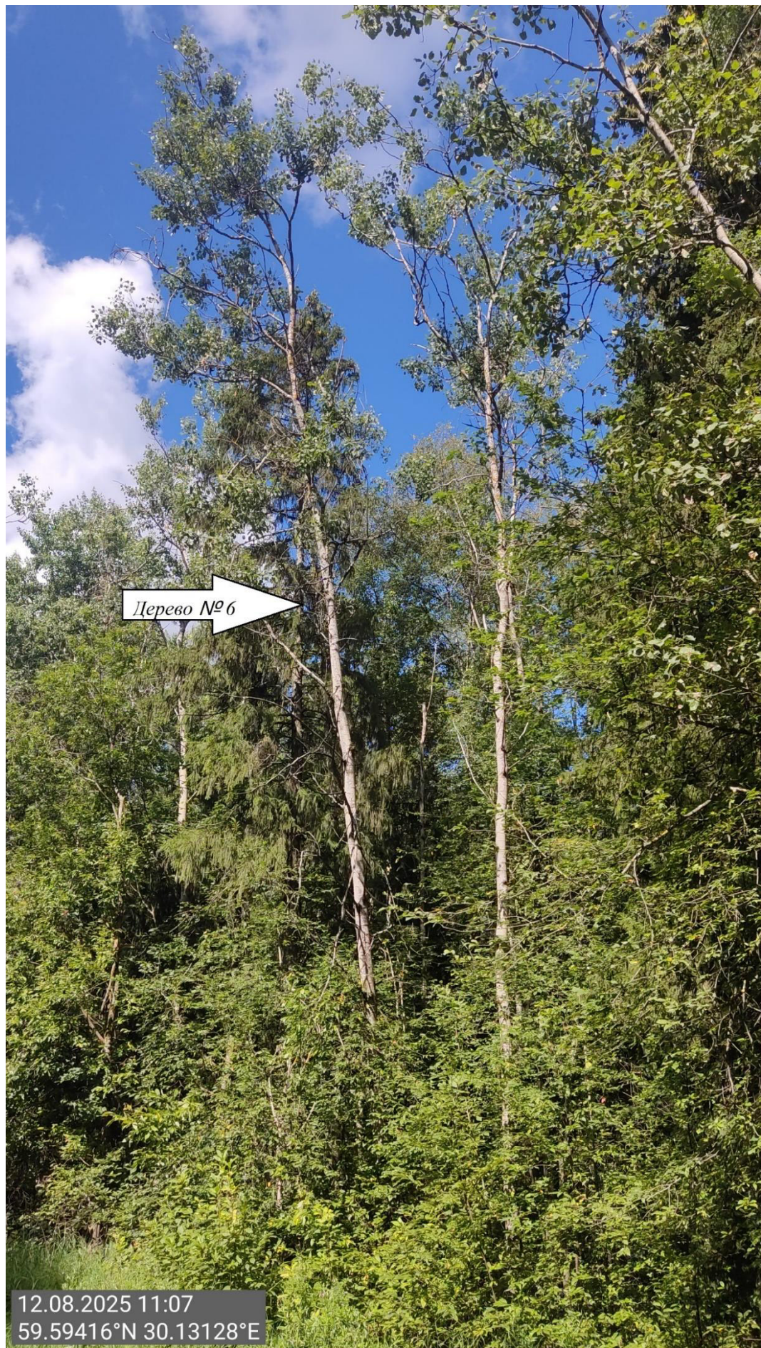
Дерево № 6