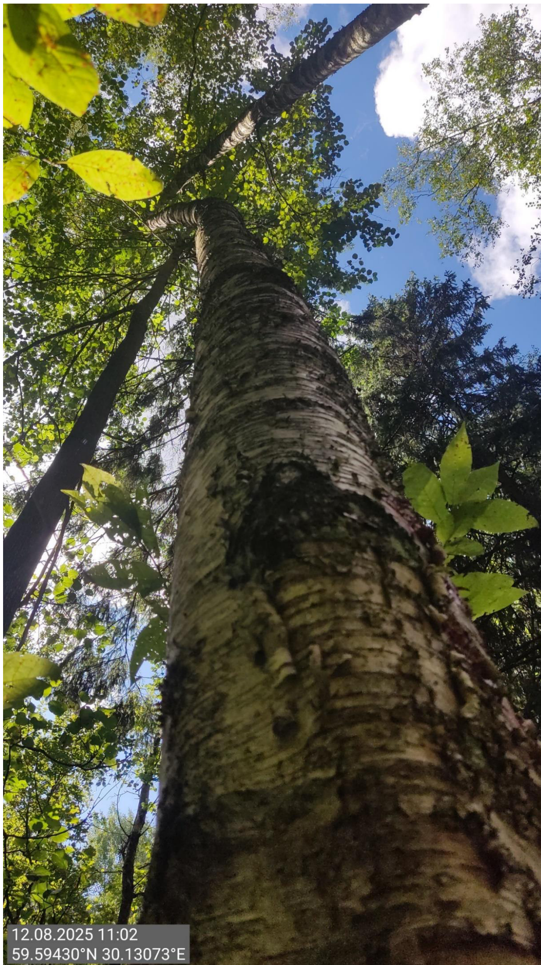
Дерево № 3