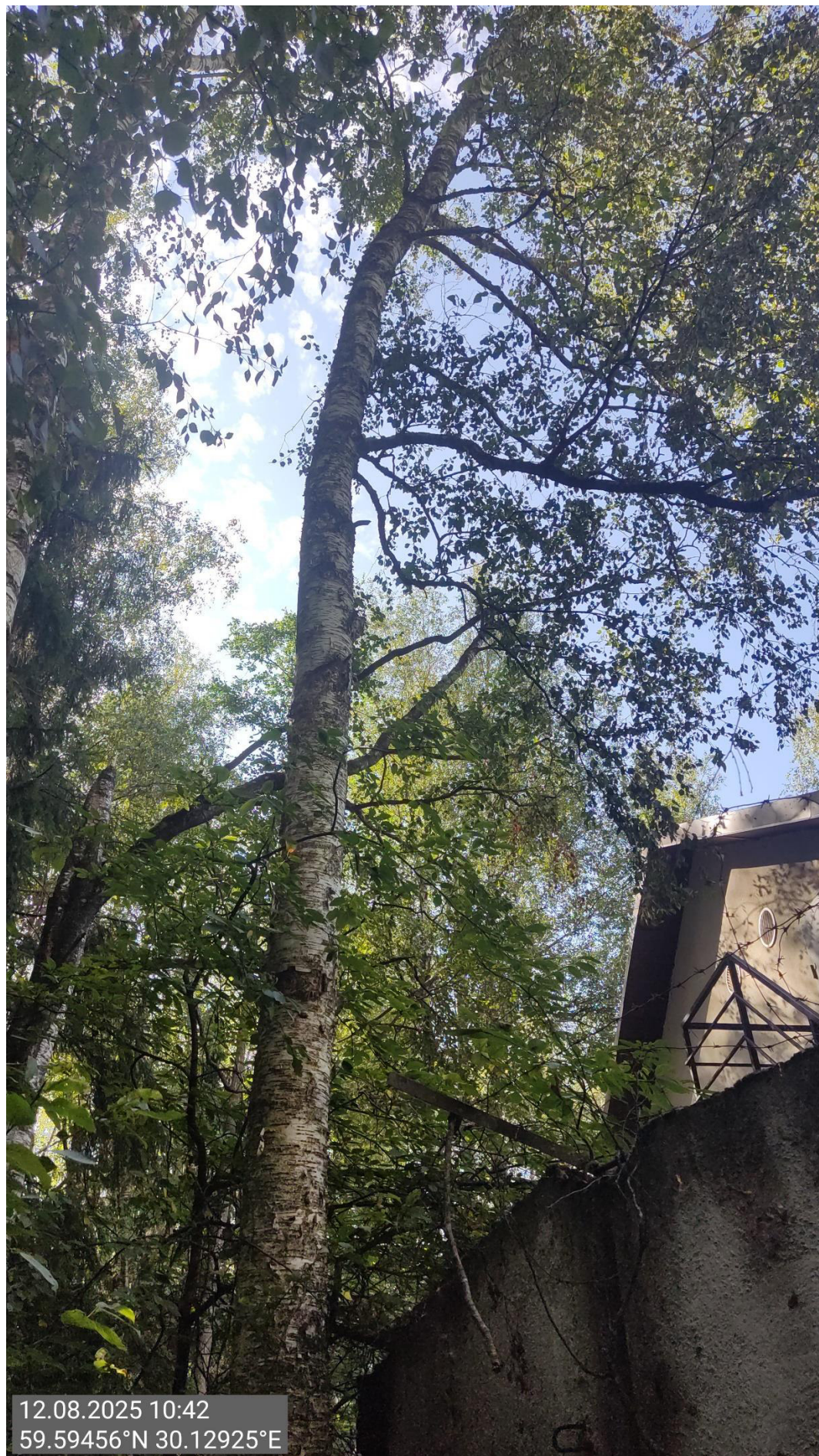
Дерево № 10