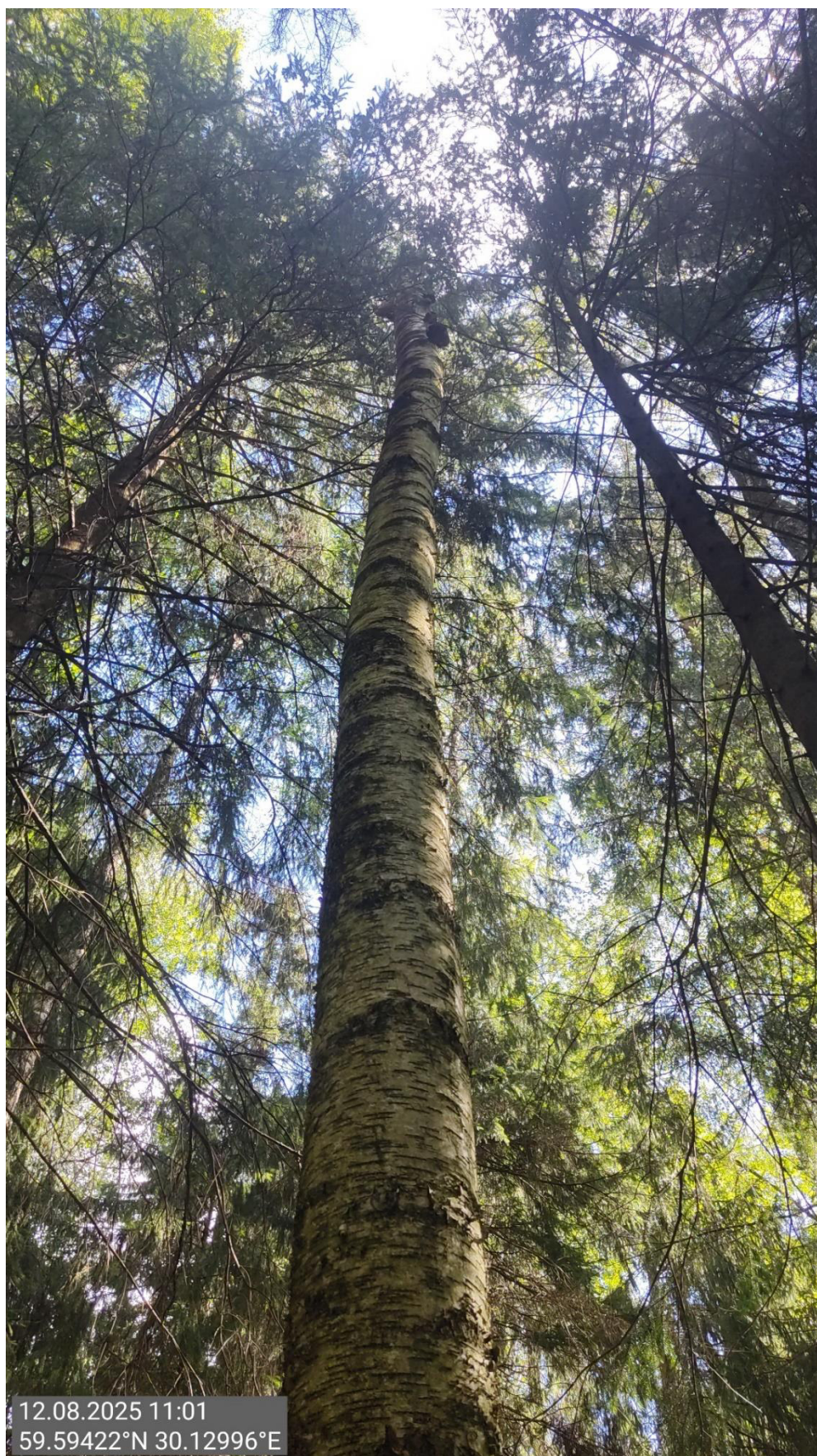
Дерево № 1