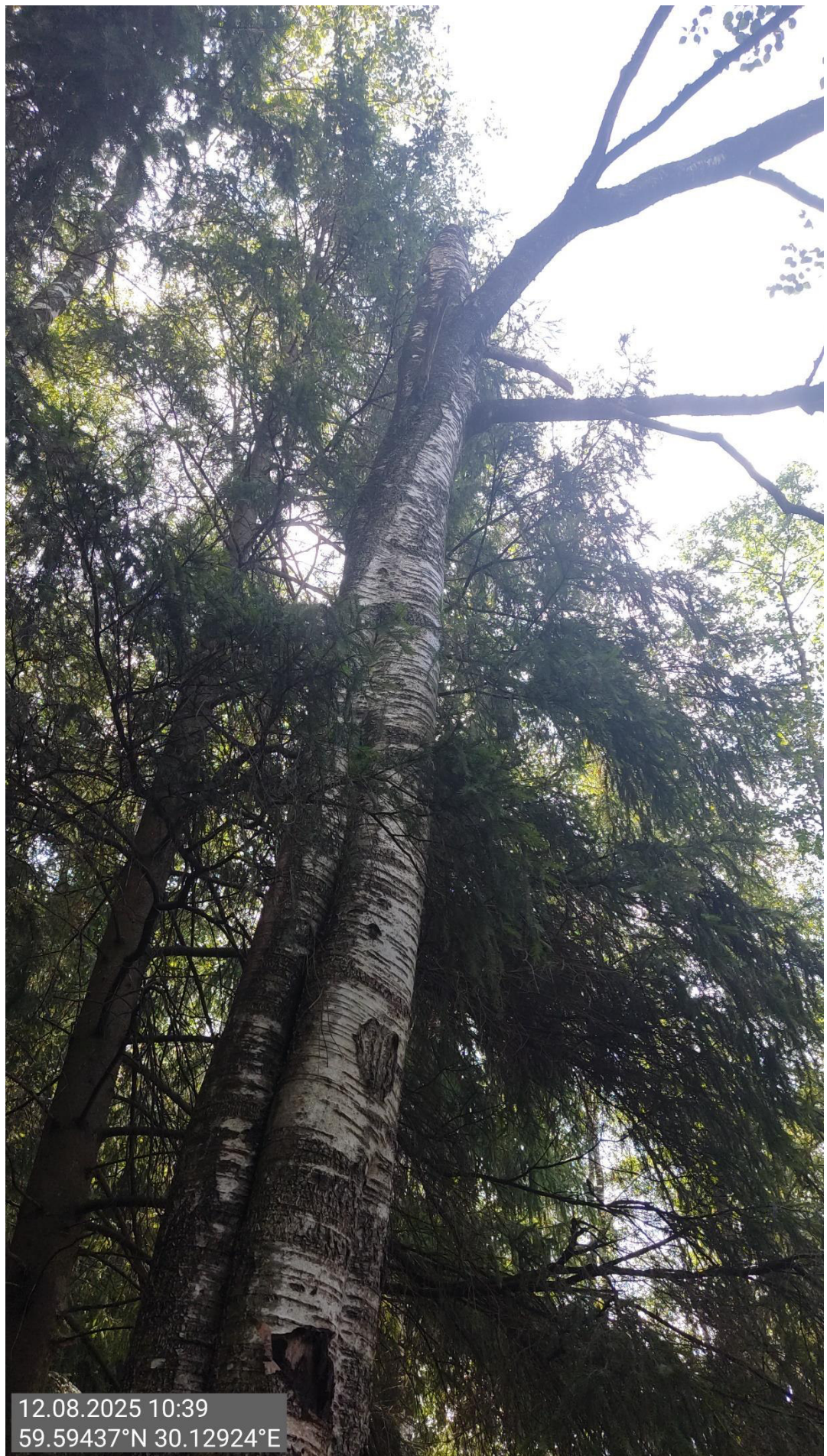
Дерево № 8