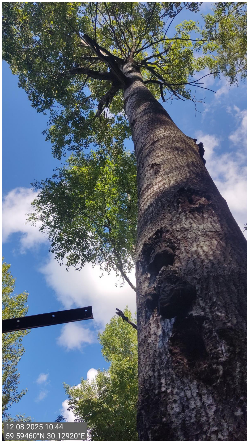
Дерево № 11