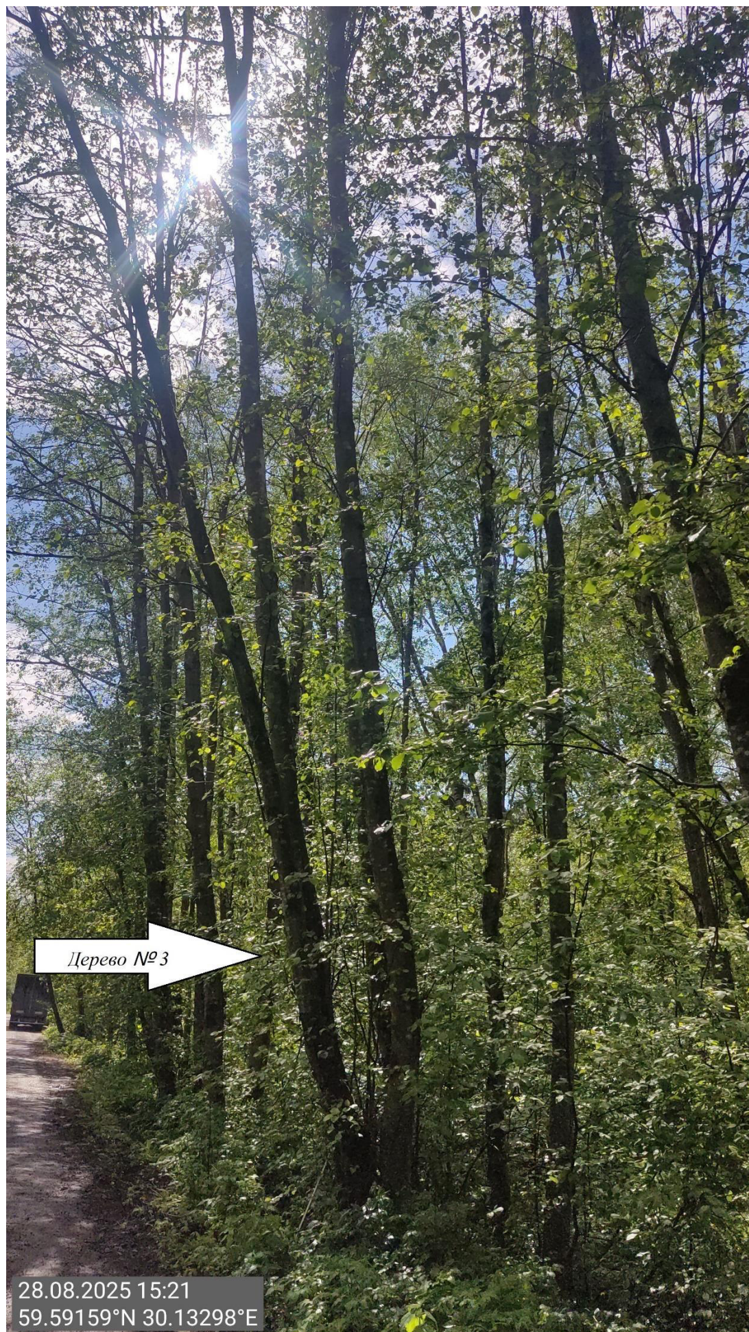
Дерево № 3