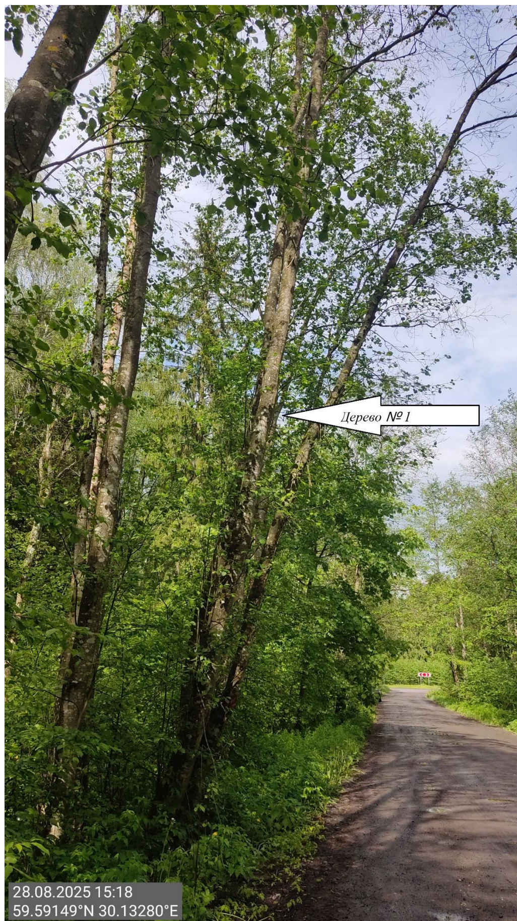
Дерево № 1