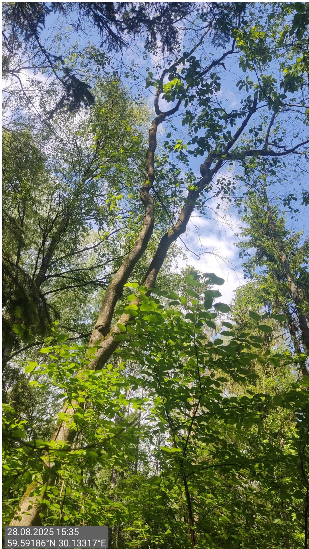
Дерево № 7