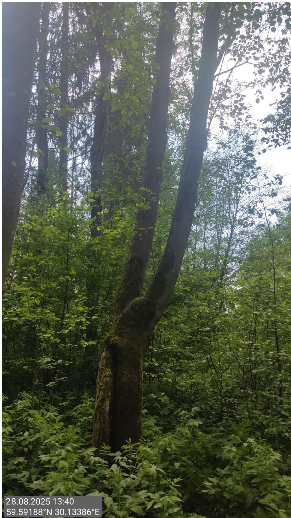
Дерево № 2