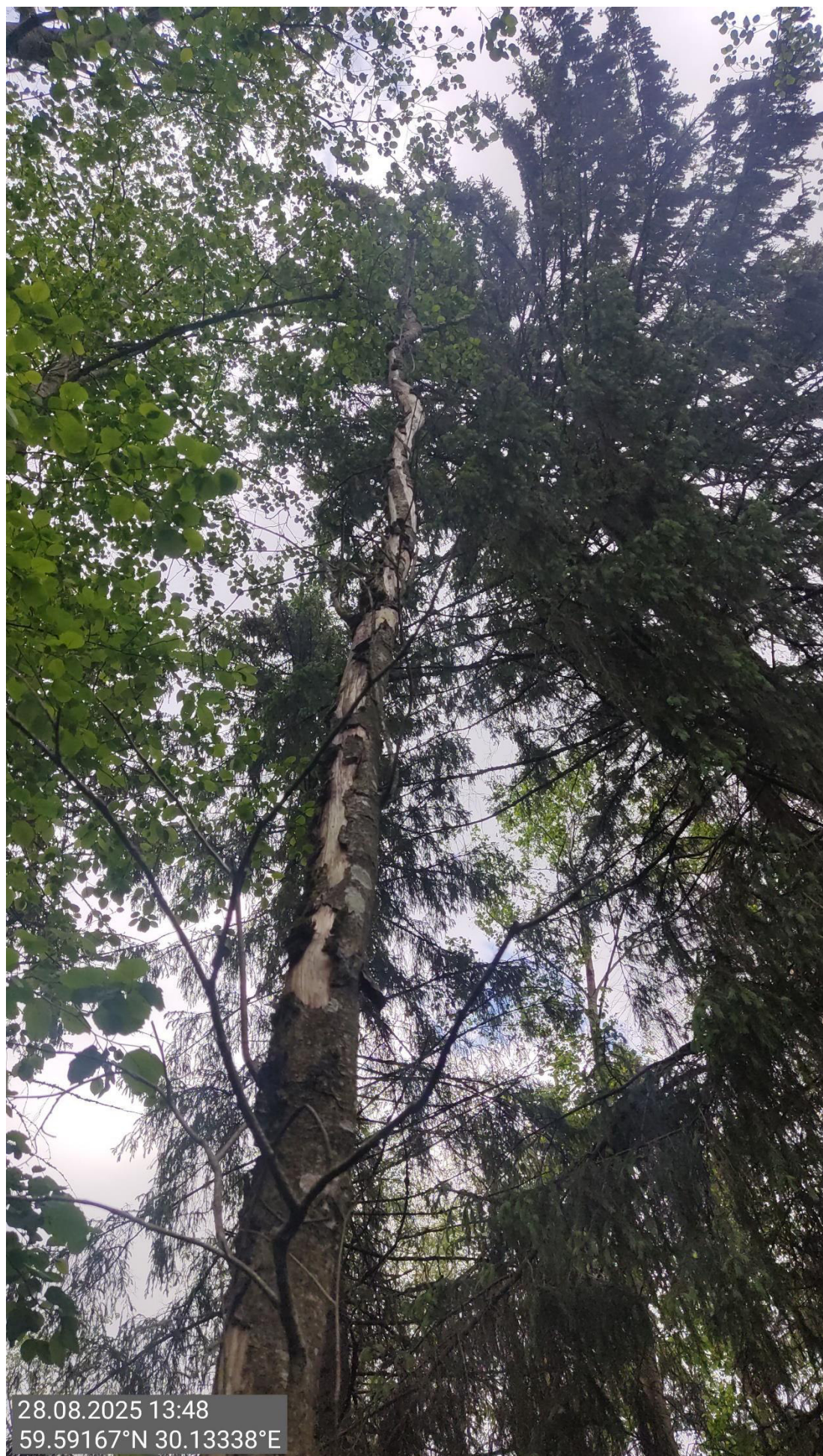
Дерево № 5