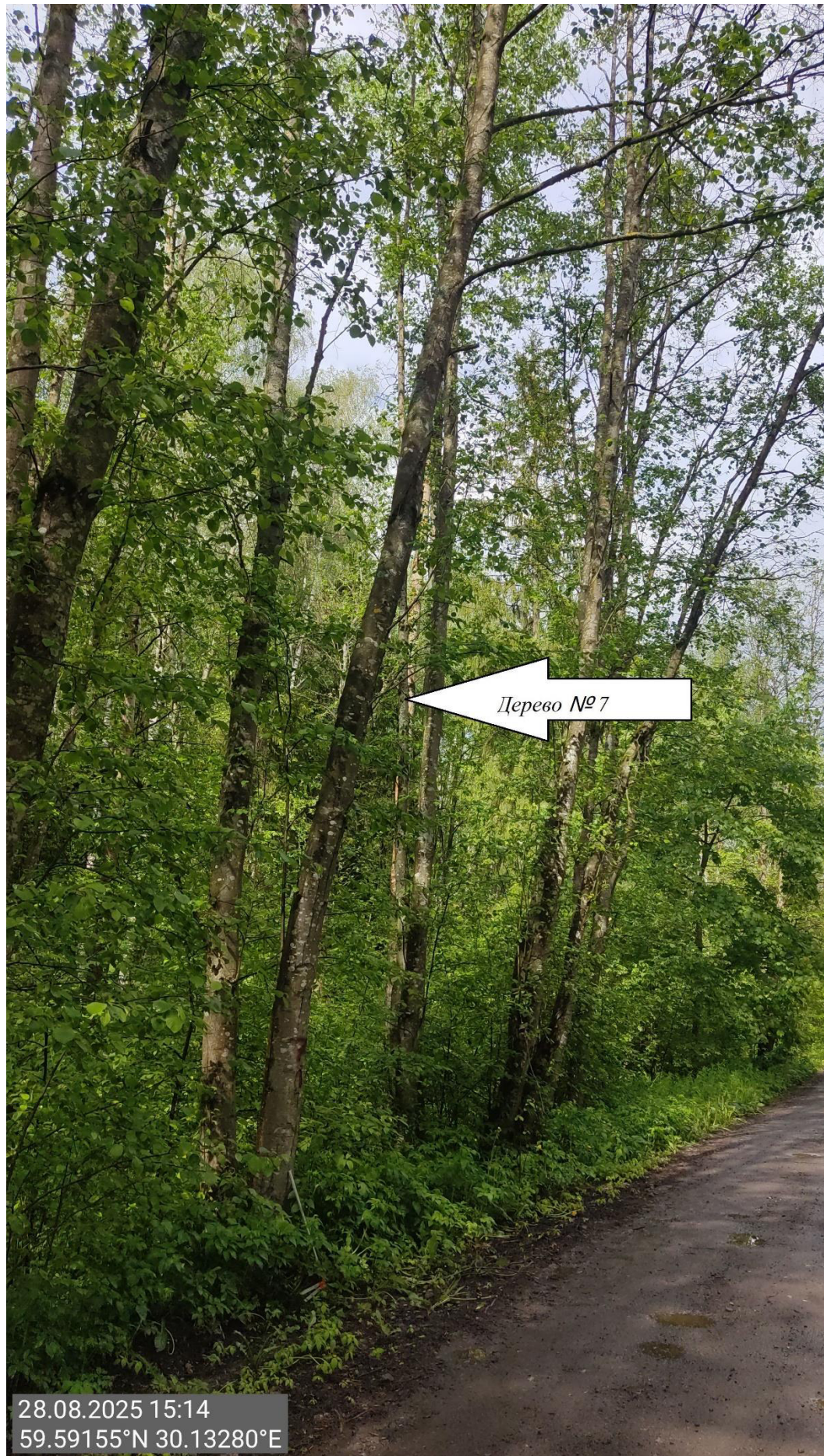
Дерево № 7