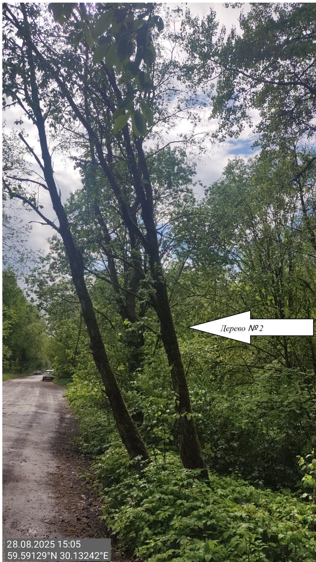
Дерево № 2