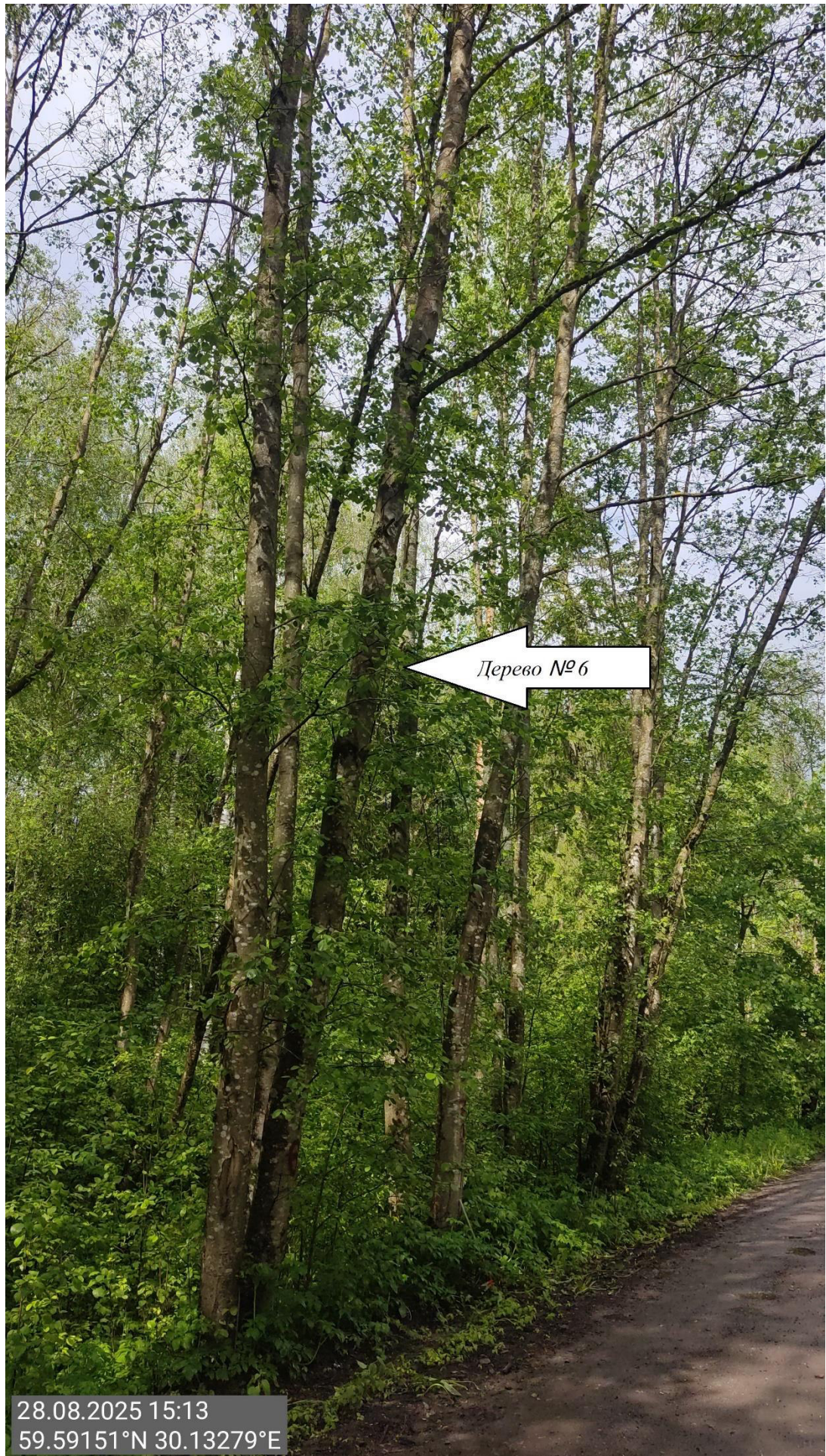
Дерево № 6